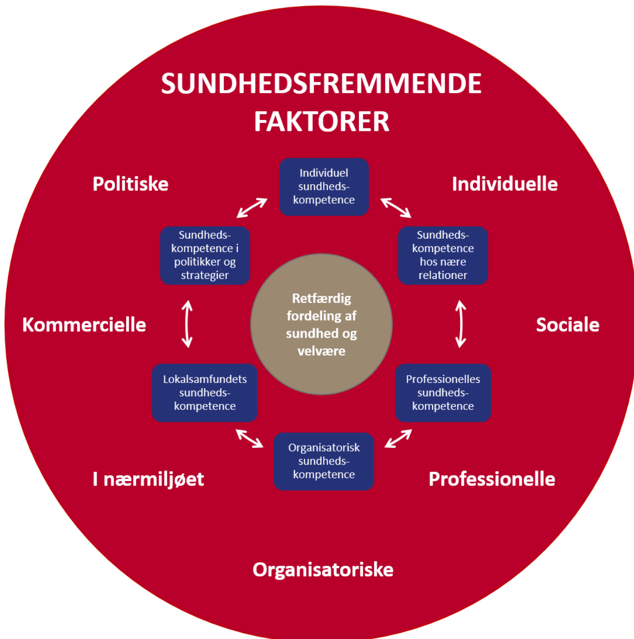
Figur 1: Model for sundhedskompetence som socioøkologisk ressource i samfundet*.